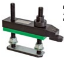
Bride de serrage 001-300 avec cale réf. LP 001-298