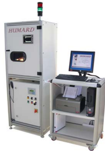
Optischer Mess-Stand für Wellen