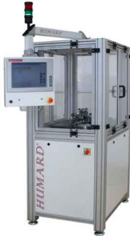
Maschine zur Messung von Wellen