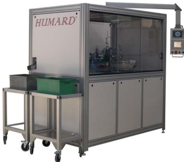
Machine pour l'assemblage et le contrôle de roulements à billes