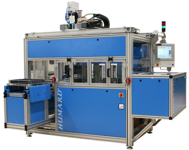
Macchina automatica per il confezionamento e il controllo