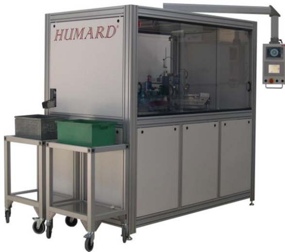
Macchina automatica di assemblaggio e controllo per cuscinetti a sfere