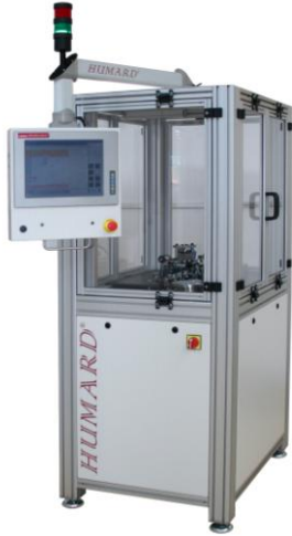
Macchina automatica per la misura degli assi