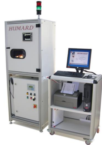
Postazione di misura ottica degli assi